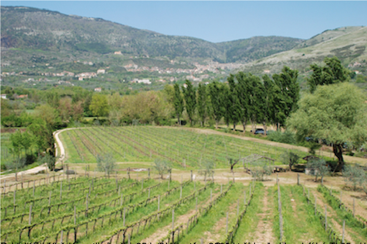
Paesaggio della tenuta di Montebello, 2000 ettari, con vigna, frutteto e parco.